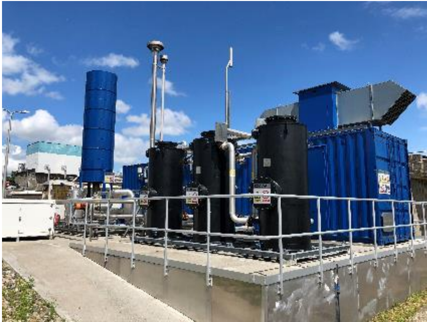
AWZI De Groote Lucht